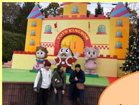
楽しい旅行にいました!!

毎年ご利用者が楽しみにされている旅行が今年度も開催されました。今年度もご利用者の「遊園地に行きたい!」「温泉に入りたい!」という希望があり、行き先を『東条湖 おもちゃ王国』『はわい温泉 望湖楼』『三朝温泉 万翠楼』へ行きました。東条湖おもちゃ王国ではジェットコースターで風を感じたりゴーカートの運転を体験したりしながら遊園地を満喫し、たくさんのお土産を購入して嬉しそうにされている姿が印象的でした。万翠楼や望湖楼の温泉施設では豪華な料理を舌鼓し、ゆっくりと温泉に浸かって日ごろの疲れを癒していました。道中のバスの車内でも外の風景を眺めたり会話を楽しんだりと思い思いの時間を過ごされていました。「次は水族館に行きたい!」と次回の旅行を早くも心待ちにしているご利用者もおられ、笑顔いっぱいの旅行となりました。